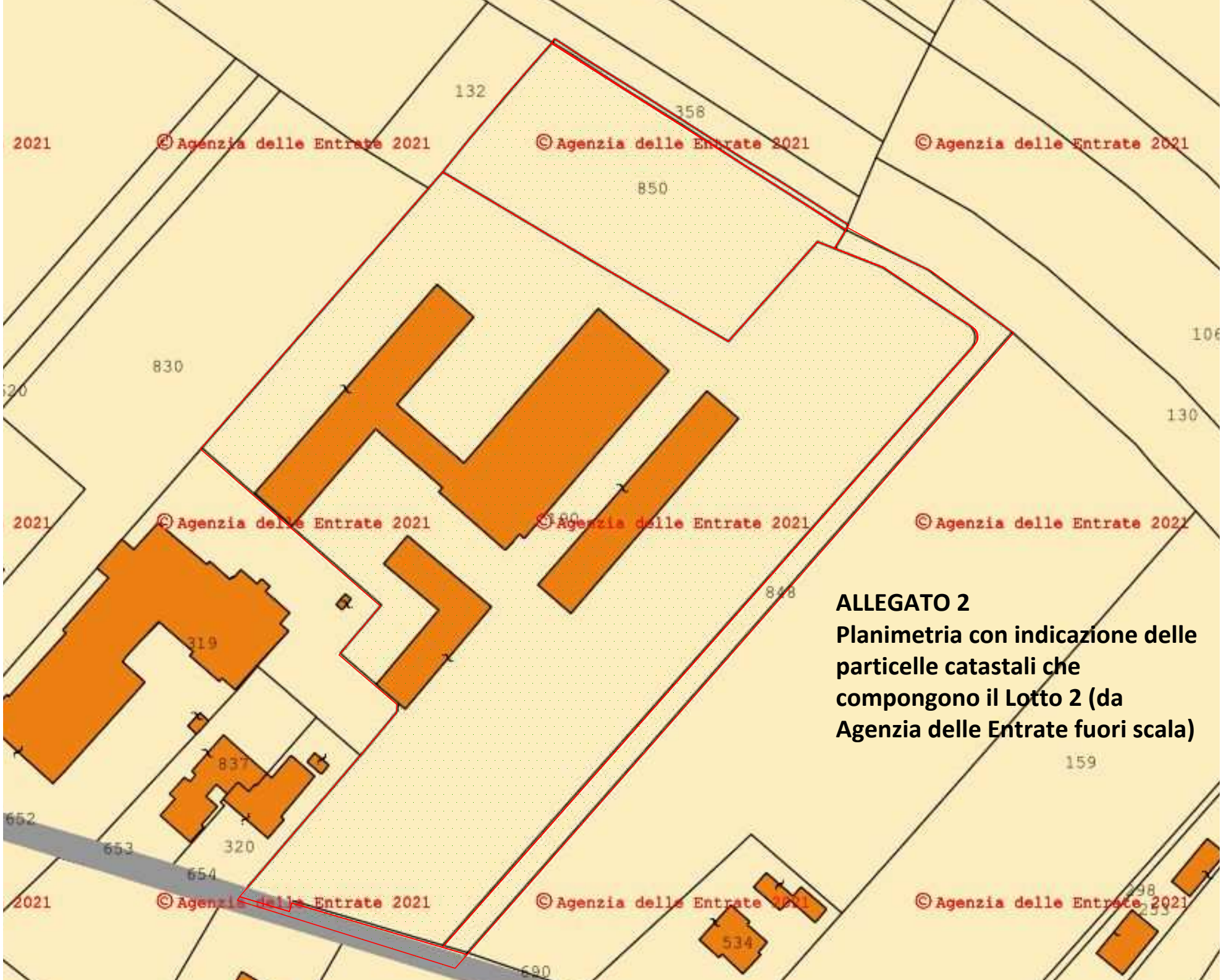
ALLEGATO 2 Planimetria con indicazione delle particelle catastali che compongono il Lotto 2 (da Agenzia delle Entrate fuori scala)