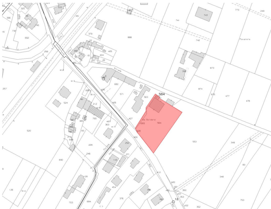
ESTRATTO DI MAPPA

Il complesso in cui sono ubicati beni oggetto di stima è indicato nelle planimetrie seguenti: