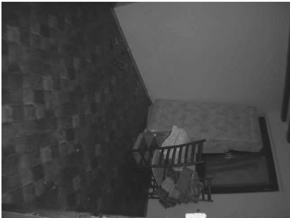
Camera piano primo