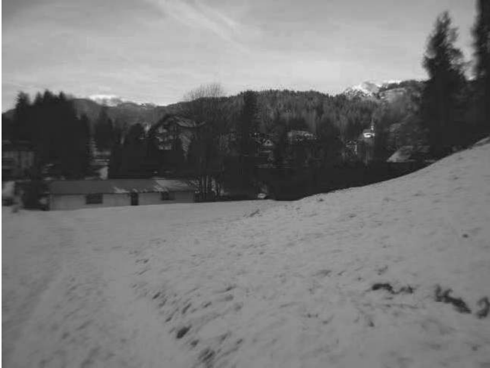
Mappale 172 e 33