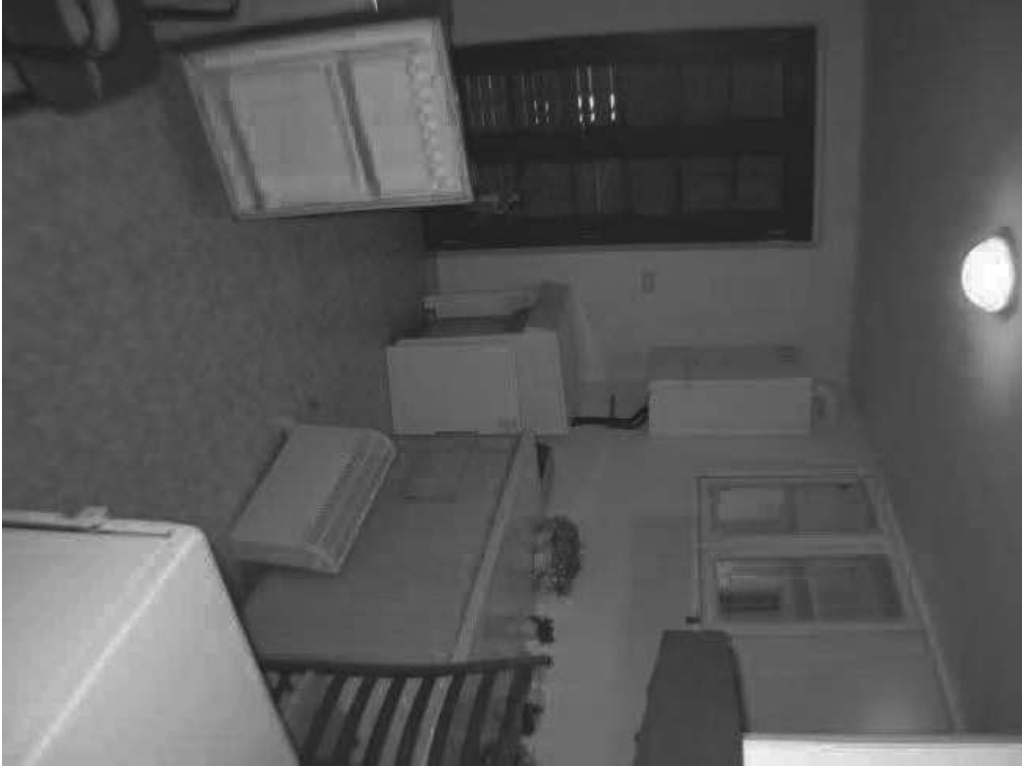
Cucina piano primo