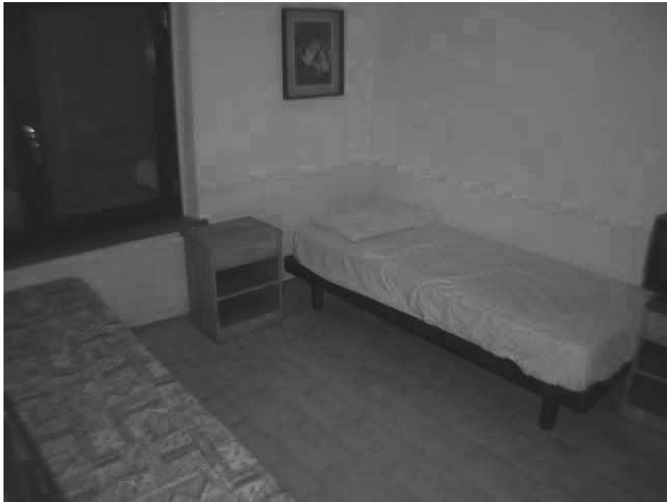
Camera piano terra