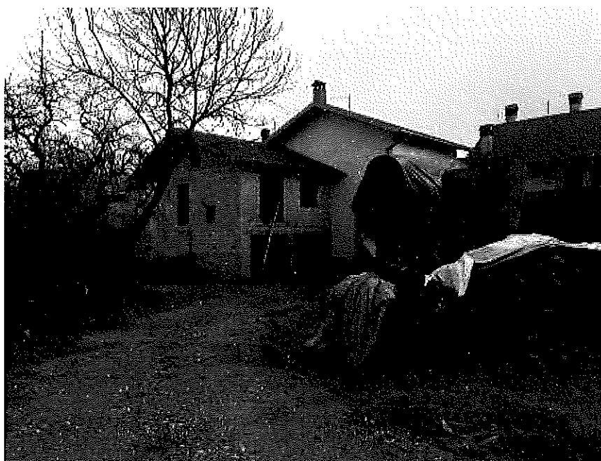
fabbricato a destinazione residenziale unifamiliare in località Pranolz (Trichiana)

2.C Ad Ovest, rispetto ai precedenti stabili, l'immobile contraddistinto al F.22; M.217, riguarda un fabbricato per funzioni produttive connesso alle attività agricole. La prima edificazione risale alla metà degli anni '80, poi successive trasformazioni hanno portato alla costituzione del fabbricato attuale. Lo stabile, in parte costruito in cemento armato ed in parte in ferro, ha una copertura in travi in legno lamellare. È costituita al piano terra dai box per i capi di bestiame, le corsie di foraggiamento, sala latte, sala mungitura, disimpegni, ripostigli e ricoveri attrezzi ed un servizio w.c. Al piano superiore lo spazio è quasi interamente destinato a fienile, tranne un locale destinato ad ufficio ed uno ad attrezzatura e comandi, più una stanza destinata a ripostiglio. Al piano sotto-strada un unico locale, con altezze importanti, destinato a fienile; il cui tetto è in evidente stato di usura.