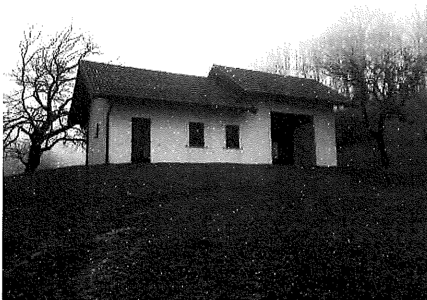
fabbricato a destinazione magazzini e locali di deposito in località Pramaor (Trichiana)