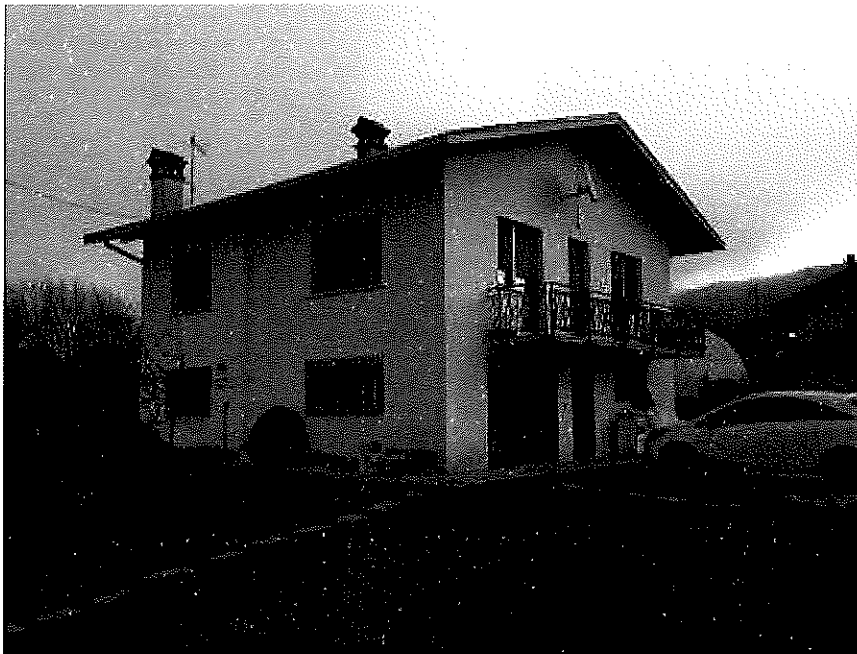
fabbricato a destinazione residenziale unifamiliare in località Pranolz (Trichiana)

1 L' Attestato di Prestazione Energetica non è presente ed al momento non può essere redatto, in quanto il generatore di calore è dichiarato non funzionante e manca del libretto di impianto, obbligatorio per la redazione dell'A.P.E.