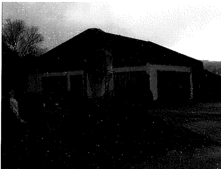
fabbricato a funzioni produttive connesso alle attività agricole in località Pranolz (Trichiana)

2.D A circa 1500 metri, in direzione Nord – Est, si colloca il fabbricato destinato a magazzini e locali di deposito; costruito nei primi anni del '900, è stato oggetto di incendio nel 1995; la ricostruzione è avvenuta nelle modalità e tipologie tipiche della zona, con muratura in mattoni portanti, intonacatura a civile, il tetto in legno e manto in coppi. Internamente trovano posto una stanza ad uso generico, un deposito ed un ricovero attrezzi, al piano primo una soffitta e l'affaccio sul piano sottostante. Fa parte del blocco anche un volume, dirimpetto a quello suddetto, destinato in passato a "casel" per il mantenimento dei laticini. Quest'ultimo, ancora in buono stato di conservazione, mantiene caratteristiche peculiari di rilievo, per quanto concerne la tipologia costruttiva dell'area prealpina bellunese.